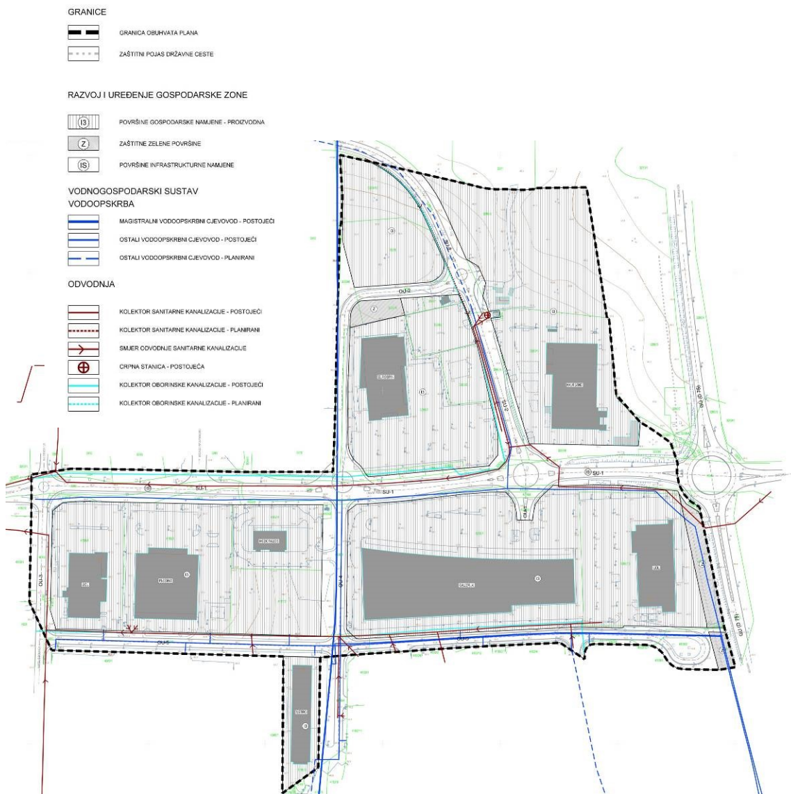
UPU Servisna zona Poreč - područje II, kartografski prikaz