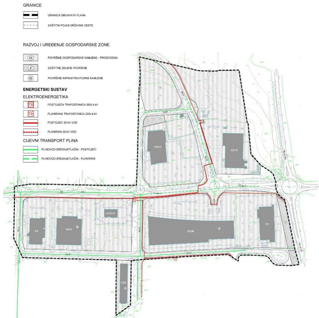
UPU Servisna zona Poreč - područje II, kartografski prikaz