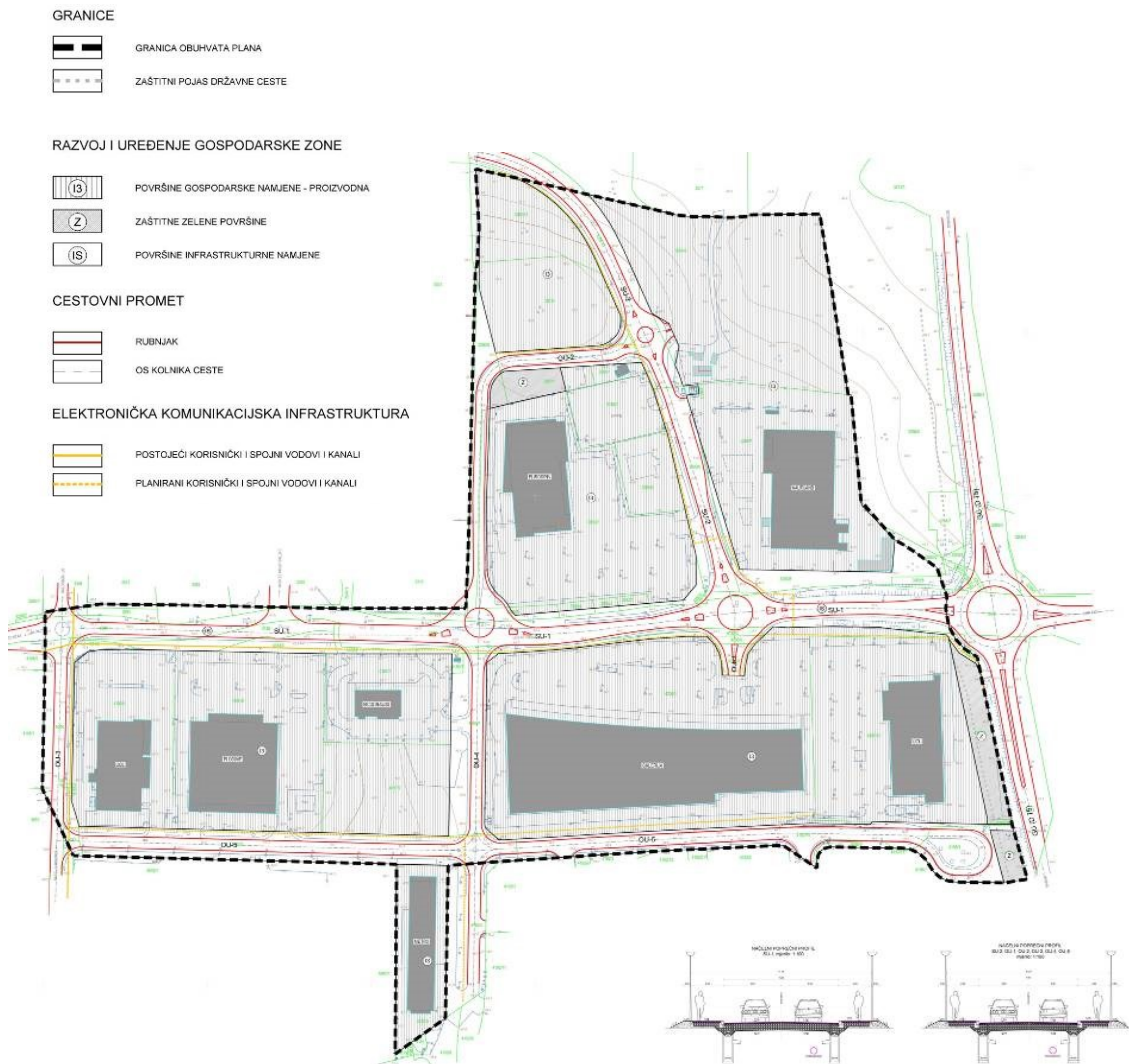
UPU Servisna zona Poreč - područje II, kartografski prikaz

2a. Prometna, ulična i komunalna infrastrukturna mreža, Prometni sustav i elektroničke komunikacije