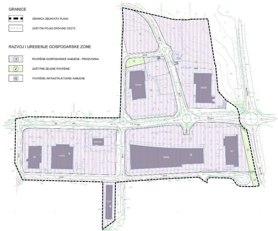
UPU Servisna zona Poreč - područje II, kartografski prikaz 1. Korištenje i namjena površina

Mijenja se odredba čl.23. st.6. u poglavlju Gospodarska namjena- proizvodna (13) :