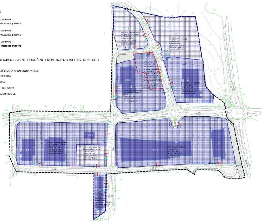
UPU Servisna zona Poreč - područje II, kartografski prikaz 3. Uvjeti korištenja i zaštite prostora

Uvjeti i način gradnje ostaju nepromijenjeni u tekstualnom dijelu, osim kod odredbe čl.27. Oblik i veličine građevne čestice: